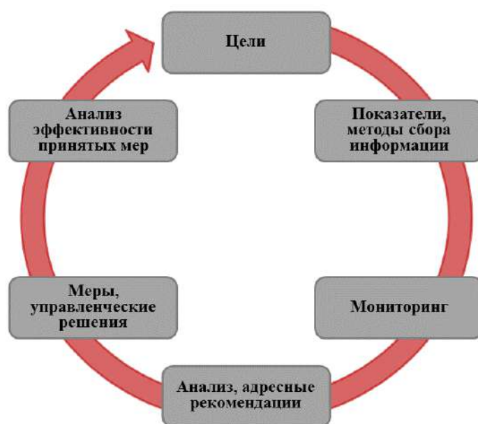
Рисунок 3 – Структура управленческого цикла

Реализация первых двух компонентов возможна через разработку регионами концептуальных документов (программ). Последующие четыре компонента реализуются через принятые регионами подходы (действия).