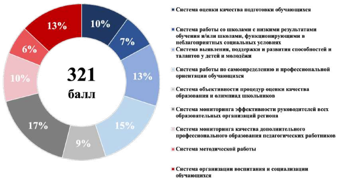
Рисунок 2 – Структура итогового балла

1.8. Максимальный итоговый балл по результатам проведения оценки составляет 321 балл. Структура итогового балла представлена на рисунке 2.